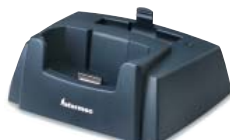
Desktop Dock Ethernet

Der 2D-Imager ist zusätzlich in der Lage, Schwarz-Weiß-Fotografien für Anwendungen wie z.B. Liefernachweise, Marktbefragungen und Außendienst-Kontrollen, zu scannen. Linear 1D und PDF 417 Laser Scanner vervollständigen das Scanner-Angebot.