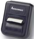
PB 20-Bluetooth Printer 2.5"