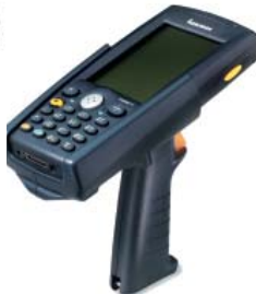
700 Scan Handle